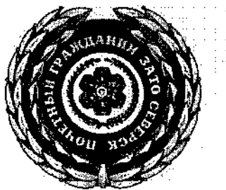
РИСУНОК нагрудного знака «Почетный гражданин ЗАТО Северск»

Приложение 3 к Решению Думы ЗАТО Северск от _____ № _____